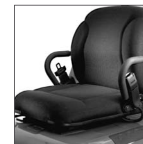
Marktführendes ergonomisches Design