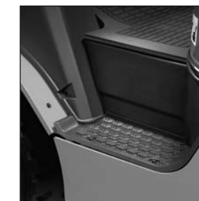
Leichter Auf- und Abstieg