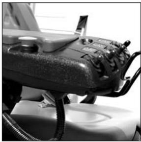
Fingertipp Hydraulikkontrolle (Zubehör)